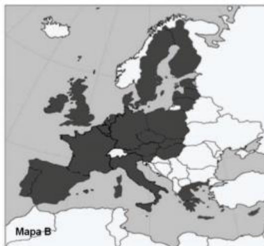
Mapa B. ....