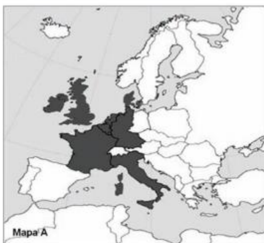
Mapa A. ....

14. Mapy przedstawiają proces rozwoju terytorialnego Unii (Wspólnot) Europejskiej. Do zamieszczonych map dobierz odpowiadające im tytuły. W wyznaczone miejsca wpisz właściwe numery.