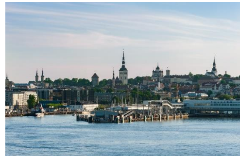
Widok na Tallin