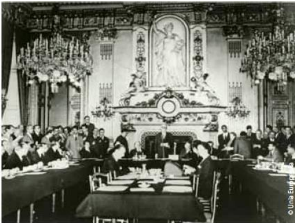
Schuman wygłaszający swoją słynną przemowę 9 maja 1950 r. Data ta jest obecnie uważana za dzień narodzin UE.

Plan Schumana uważa się za załączek tego, czym dzisiaj Unia Europejska. Ze względu na znaczenie deklaracji Schumana z 9 maja 1950 r., dzień ten, decyzją Rady Europejskiej z 1985 r. został ustanowiony Dniem Europy.